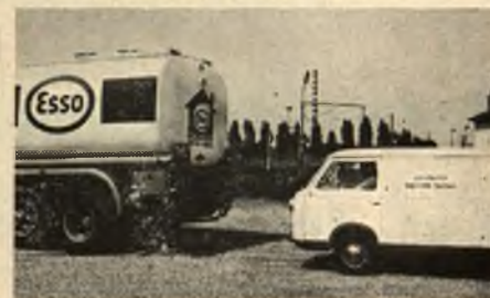
Affidarsi al servizio e ai prodotti Esso Casa.