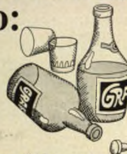
Bere due litri di grappa al giorno.