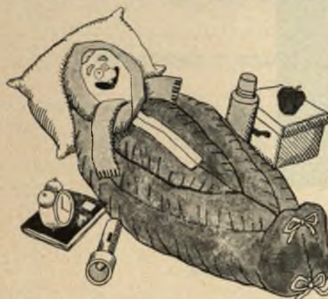
Andare in letargo ai primi di ottobre.