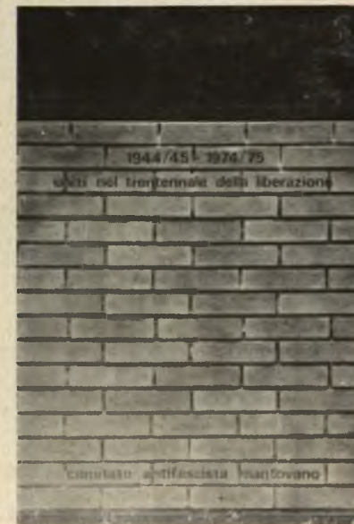
Il manifesto del Comitato antifascista cittadino.