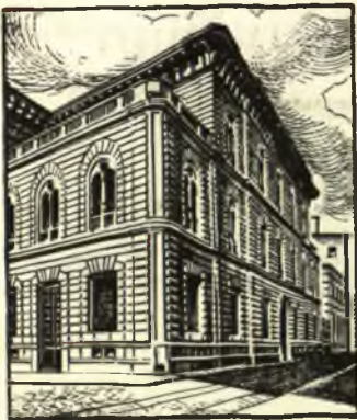
Il Palazzo della Direzione Centrale in Via Monte di Pietà 8 a Milano