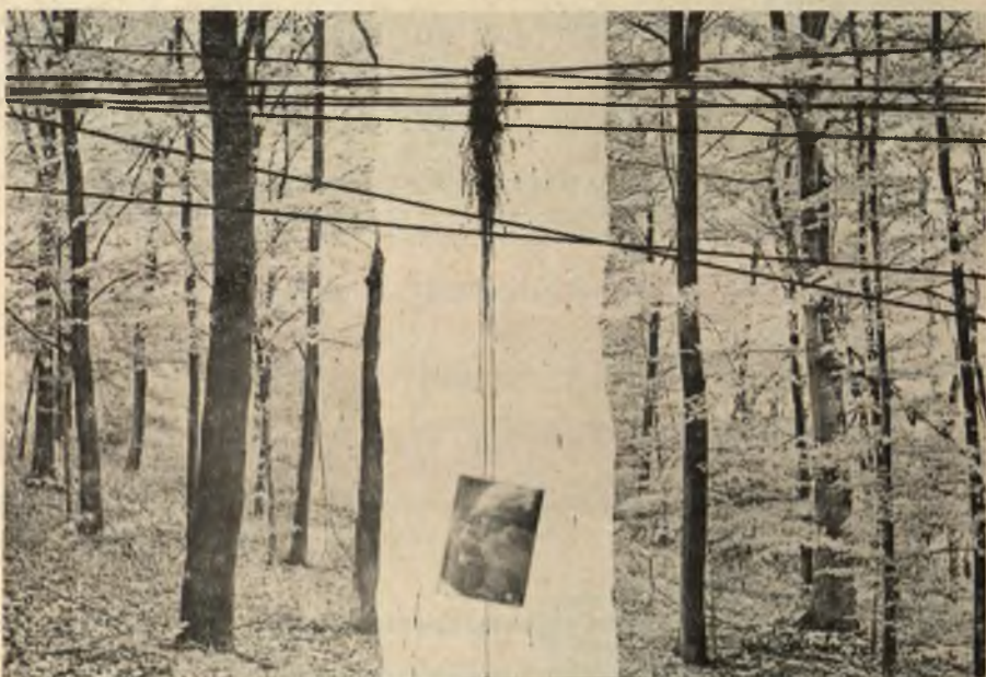
Il grande collage che Nani Tedeschi ha realizzato per l'edificio scolastico « Salvador Allende »