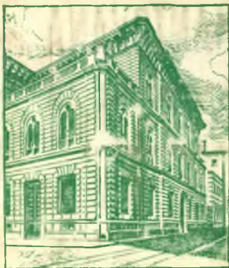
Il Palazzo della Direzione Centrale in Via Monte di Pietà 8 a Milano